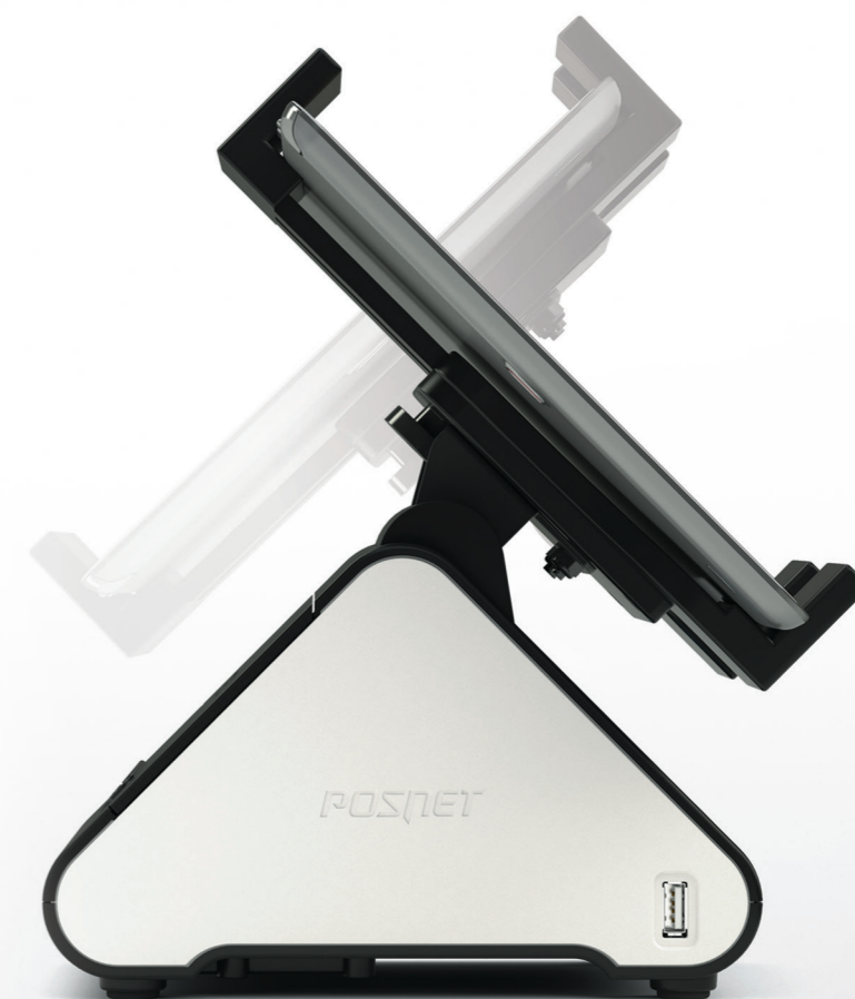
TRIO drukarka fiskalna

Niezawodna drukarka o modułowej budowie, co pozwala zamontować na niej tablet lub smartfon.