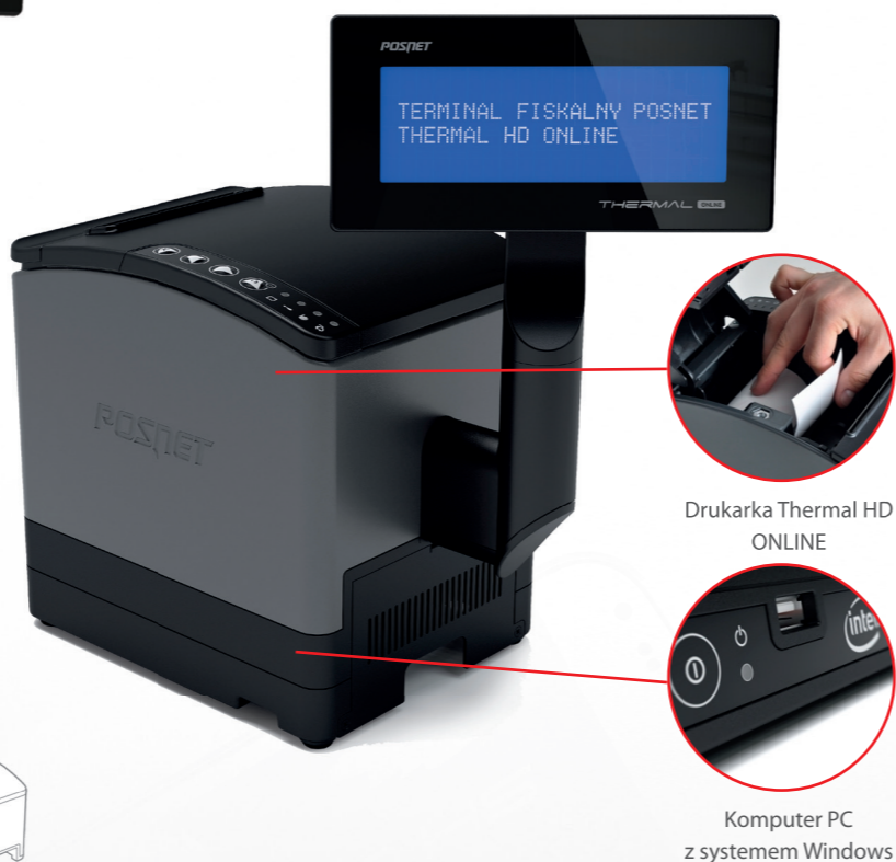
Drukarka Thermal HD ONLINE

Terminal oferuje wersje wyświetlaczy oraz wszystkie funkcje fiskalne drukarki Thermal HD ONLINE.